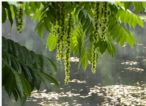
Kaukasisk vingnöt

Svenska Trädföreningen är en ideell förening som verkar för att öka kunskap och engagemang kring träd i det byggda och brukade landskapet. Föreningen samlar yrkesverksamma som arborister, landskapsarkitekter, planerare, förvaltare och forskare, men välkomnar även studenter och andra med intresse för träd och grön miljö. Genom sitt engagemang i det internationella nätverket International Society of Arboriculture (ISA) bidrar föreningen till att sprida och utveckla internationellt förankrad kunskap om träd och trädvård i en svensk kontext.