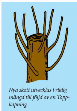
Nya skott utvecklas i riklig mängd till följd av en Toppkapning.

De överlevnadsmekanismer som får ett träd att producera flera skott under varje toppningsnitt sker på stor bekostnad för trädet. De här skotten utvecklas från skott som ligger nära de gamla grenarnas yta. Till skillnad från vanliga grenar som utvecklas i en ficka av överlappande vedvävnad, sitter de här skotten bara i de allra yttersta lagren av huvudgrenarna där de har en mycket svag förankring.