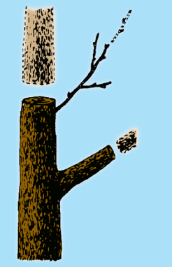
En stump lämnar dörren öppen för röta.

Toppkapning är att kapa grenar till stumpar eller att inte låta sidogrenar förbli tillräckligt stora för att upprätthålla det som återstår av grenen.